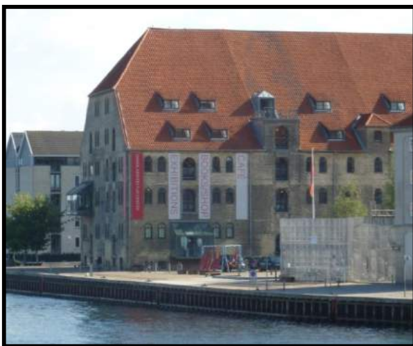
Sede del Dansk Arkitektur Center (DAC)

El DAC es una organización privada sin ánimo de lucro compuesta por Realdania y cuatro ministerios (cultura, comercio, medio ambiente y clima, energía y edificios). Estos cinco miembros son su principal fuente económica aunque también consiguen financiación puntual de otras entidades. Realdania es una fundación filantrópica dedicada a apoyar proyectos en el entorno construido (Built Environment) dentro de tres áreas de enfoque: Ciudades, edificios y patrimonio arquitectónico, su lema es "Calidad de vida para todos a través del entorno construido". El término "entorno construido" hace referencia al entorno que incluye todo tipo de construcciones en las que se dan usos mixtos, son edificios en los cuales las personas viven, disfrutan del ocio, trabajan o incluso pueden existir pequeñas empresas manufactureras o artesanales.